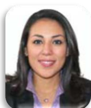
Dip. Aurora Denisse Ugalde Alegría PRI