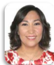
Dip. Lizbeth Loy Gamboa Song PRI